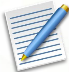
أوراق عمل + ورقة تقويمية